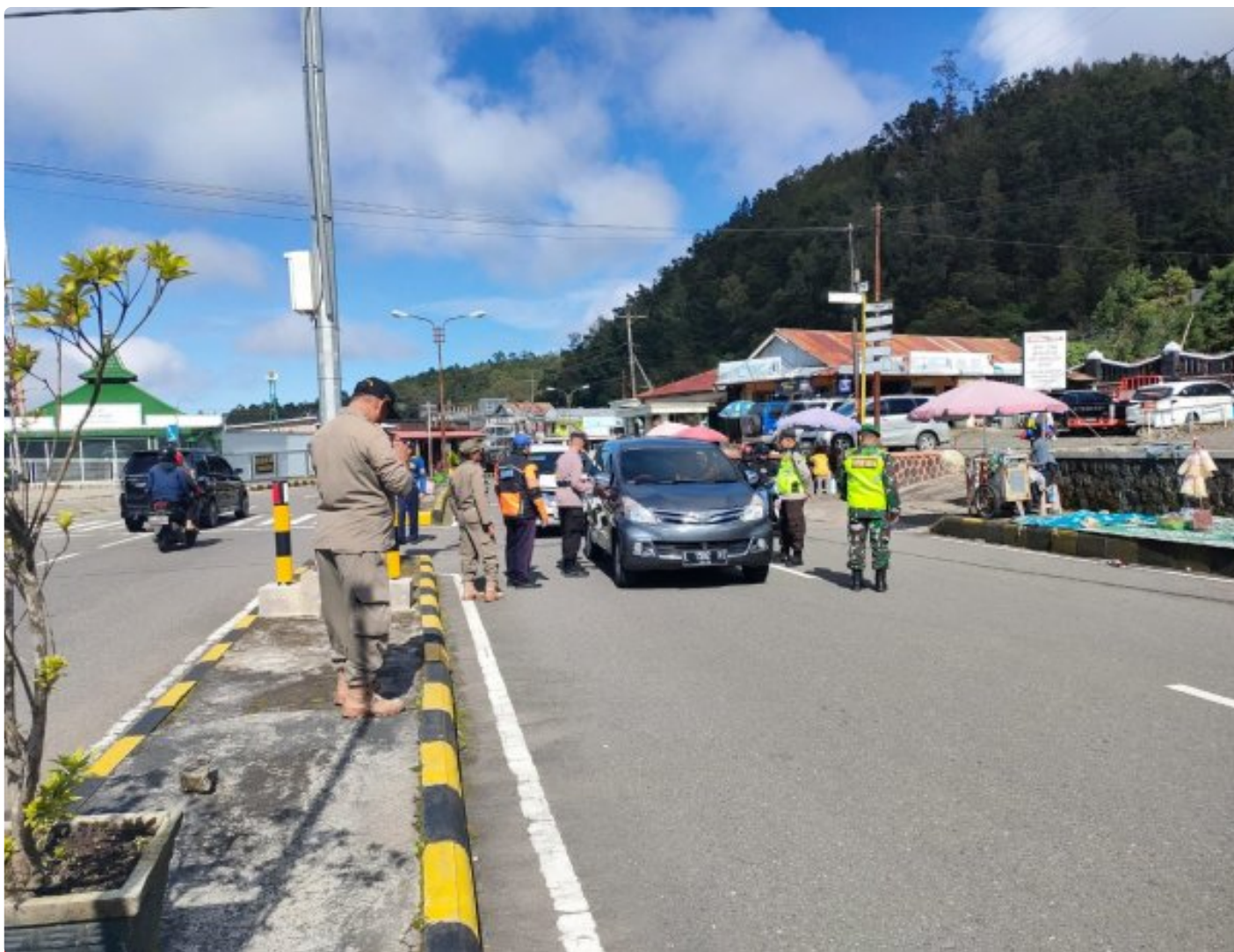
Anggota Koramil 0804/02 Plaosan Ikut Menjaga Pos Pengamanan Nataru di Wilayah Binaan

Magetan. - Anggota Koramil 0804/02 Plaosan bersama Anggota Polsek, Pol