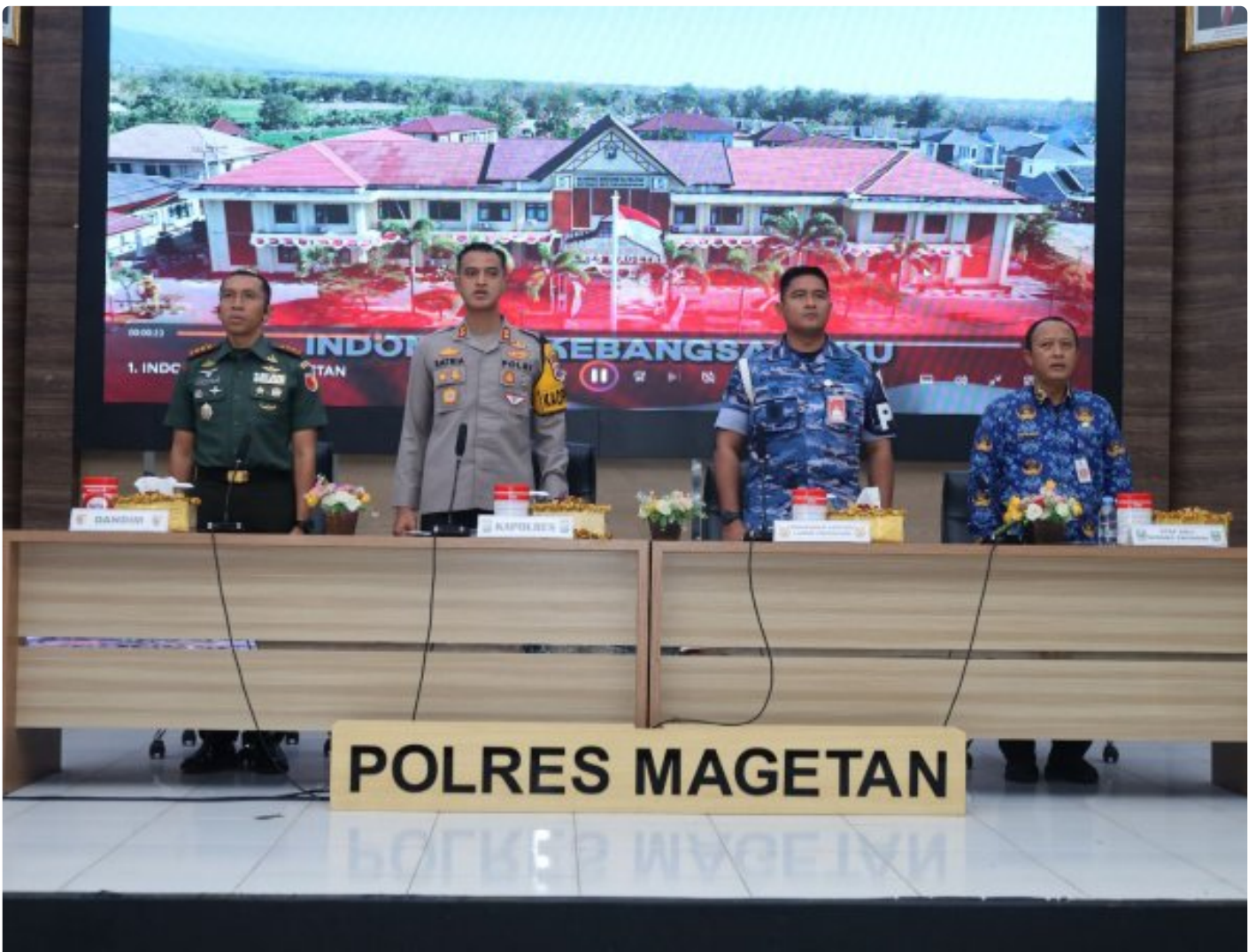
Dandim 0804/Magetan Hadiri Rakor Lintas Sektoral kesiapan operasi lilin 2024

Magetan. – Guna meningkatkan Sinergitas dalam rangka kesiapan operasi lilin 2024 pengamanan Hari Raya Natal 2024 dan Tahun Baru 2025 di wilayah Kabupaten Magetan yang aman dan kondusif.