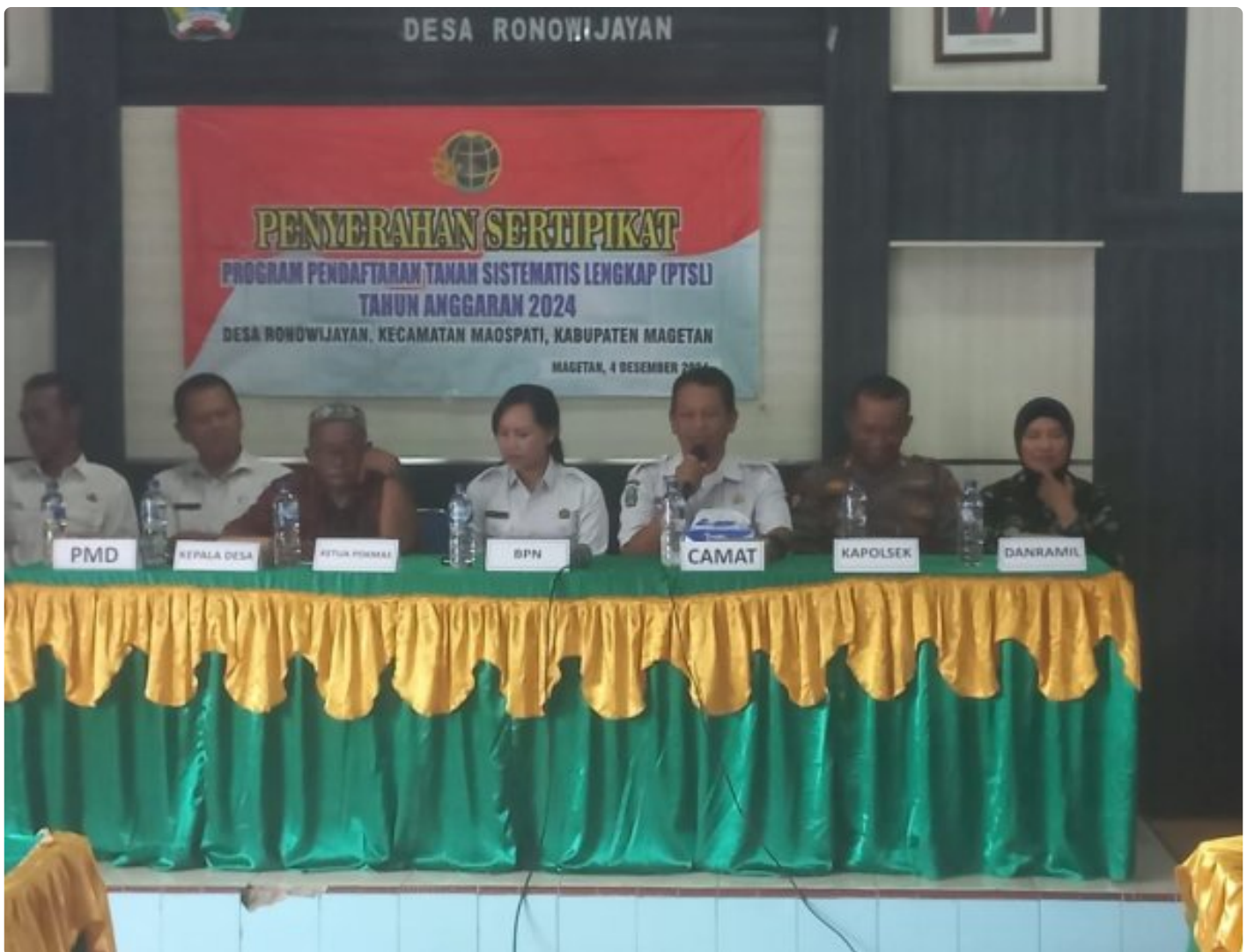
Danramil 0804/06 Maospati Hadiri Penyerahan Sertifikat PTSL Desa Ronowijayan

Magetan. - Bertempat di Balai Desa Ronowijayan, Kecamatan maospati,