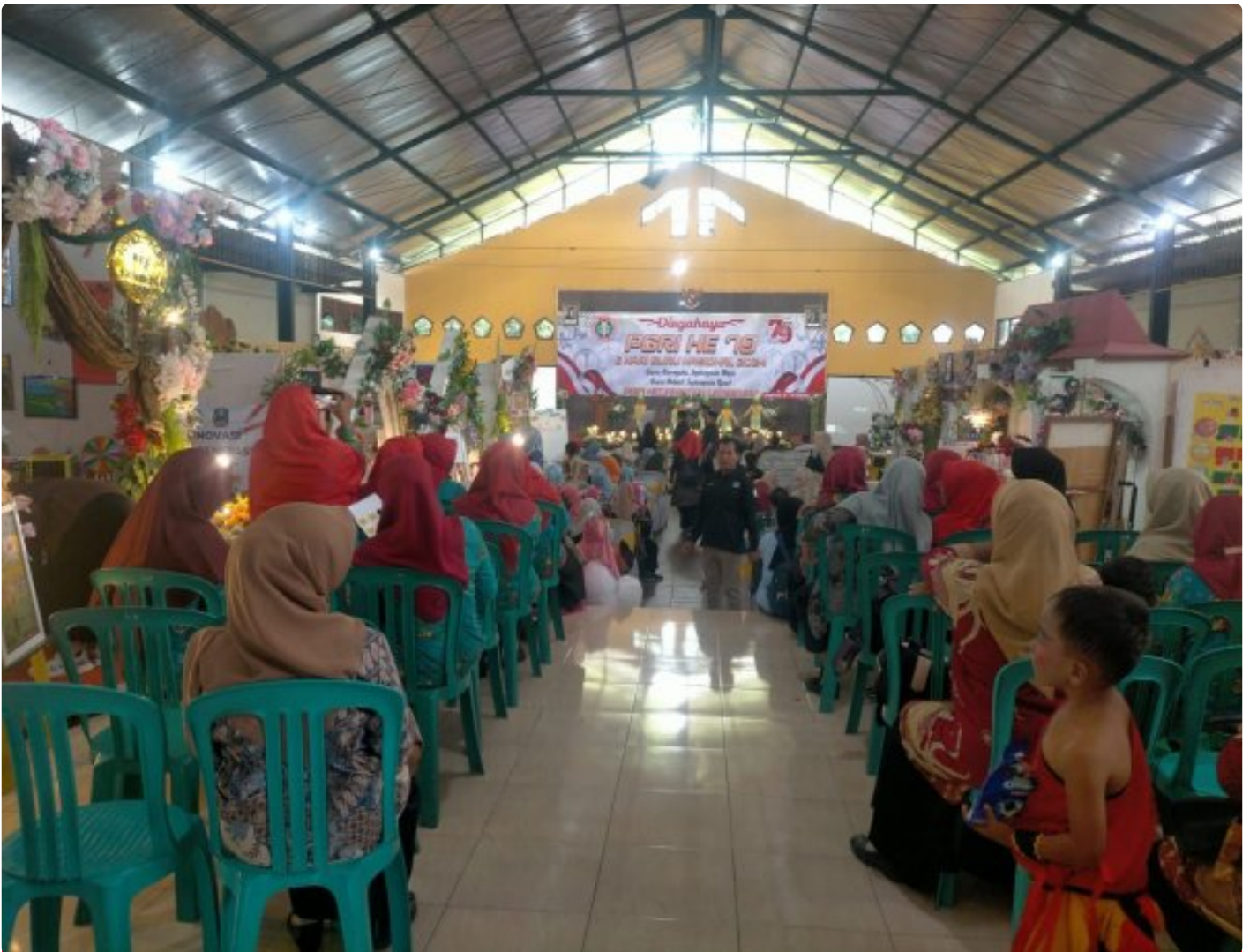
Danramil 0804/12 Lembeyan Hadiri HUT PGRI Ke-79 Dan Hari Guru Nasional (HGN) Se Kecamatan Lembeyan Tahun 2024